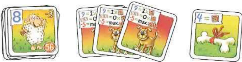
Abb. Schafherde, Hirtenhunde, Knochen

Erhältst du Hirtenhunde, legst du sie einzeln und für alle sichtbar neben den Stapel deiner Schafherde. Erhältst du den Knochen, legst du ihn ebenfalls offen neben deine Schafherde.