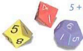
nach Robbis 3. Wurf