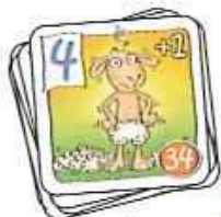
Kathrins Schafherde + Hirtenhund