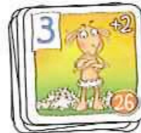
Abb. Stefans oberste Schafkarte zeigt den Bonus +2. Er kann den Bonus solange nutzen, wie diese Karte oben auf seiner Schafherde liegt.