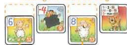
Kathrin nimmt sich das 6er und das 8er Schaf.

Kathrin hat das Gebot 24 eingestellt und möchte genau zwei Karten. Das schwarze Schaf und den Hirtenhund möchte sie nicht. Sie erreicht nach ihrem ersten Wurf die Summe von 21. Jetzt könnte sie ihren Bonus von „1“ geltend machen und zwei ihrer Wollchips zahlen, um auf ihr Gebot zu kommen. Sie bekäme dann aber drei Karten, was sie nicht will. Also legt sie einen Würfel beiseite und würfelt die beiden anderen erneut: Wieder erreicht sie 21. Diesmal setzt sie ihren Bonus ein und zahlt gerne die zwei Wollchips. Da dies ihr zweiter Wurf war, bekommt sie ihre zwei gewünschten Karten.