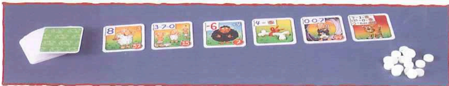
Abb. Im Spiel zu fünft legt ihr sechs Karten offen in die Tischmitte.

Vom verdeckten Stapel wird eine Karte mehr offen ausgelegt als Spieler mitspielen. (Zu Beginn der letzten Runde im Spiel zu sechst legt ihr die verbliebenen vier Karten in die Tischmitte.)