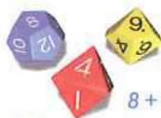
Kathrins Ergebnis nach dem 2. Wurf